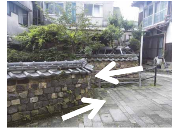
塀に沿って下った後は 小さな川沿いに歩いていく